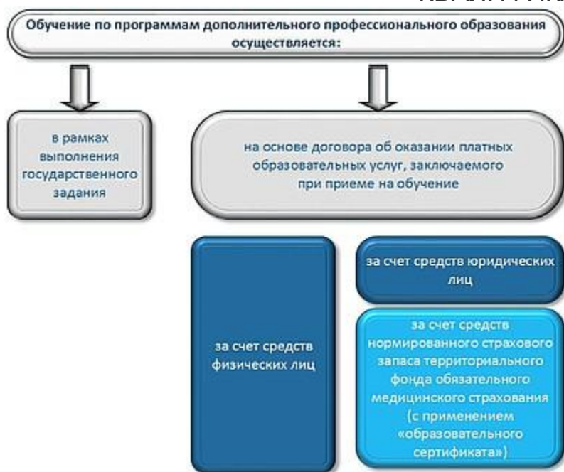
Рисунок 2. Источники финансирования дополнительного профессионального образования

Обучение специалистов по дополнительным профессиональным программам повышения квалификации, в том числе по программам непрерывного образования, в организациях, осуществляющих образовательную деятельность, может проводиться как за счет средств федерального бюджета, так и на договорной основе, в том числе с применением образовательного сертификата за счет средств нормативного страхового запаса территориального фонда обязательного медицинского страхования ( Постановление Правительства Российской Федерации от 21.04.2016 №332 «Об утверждении Правил использования медицинскими организациями средств нормированного страхового за-