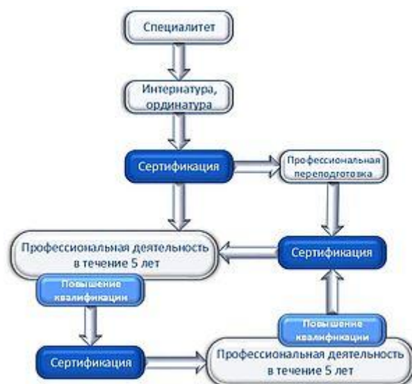
Рисунок 1. Система допуска к профессиональной деятельности через процедуру сертификации специалиста