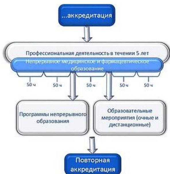
Рисунок 3. Схема индивидуального пятилетнего цикла обучения по специальности

Повышение квалификации специалистов, прошедших "последнюю" сертификацию или аккредитацию после 1 января 2016 года , будет проходить в рамках системы непрерывного медицинского и фармацевтического образования в виде индивидуального пятилетнего цикла обучения по соответствующей специальности (далее - индивидуальный пятилетний цикл).